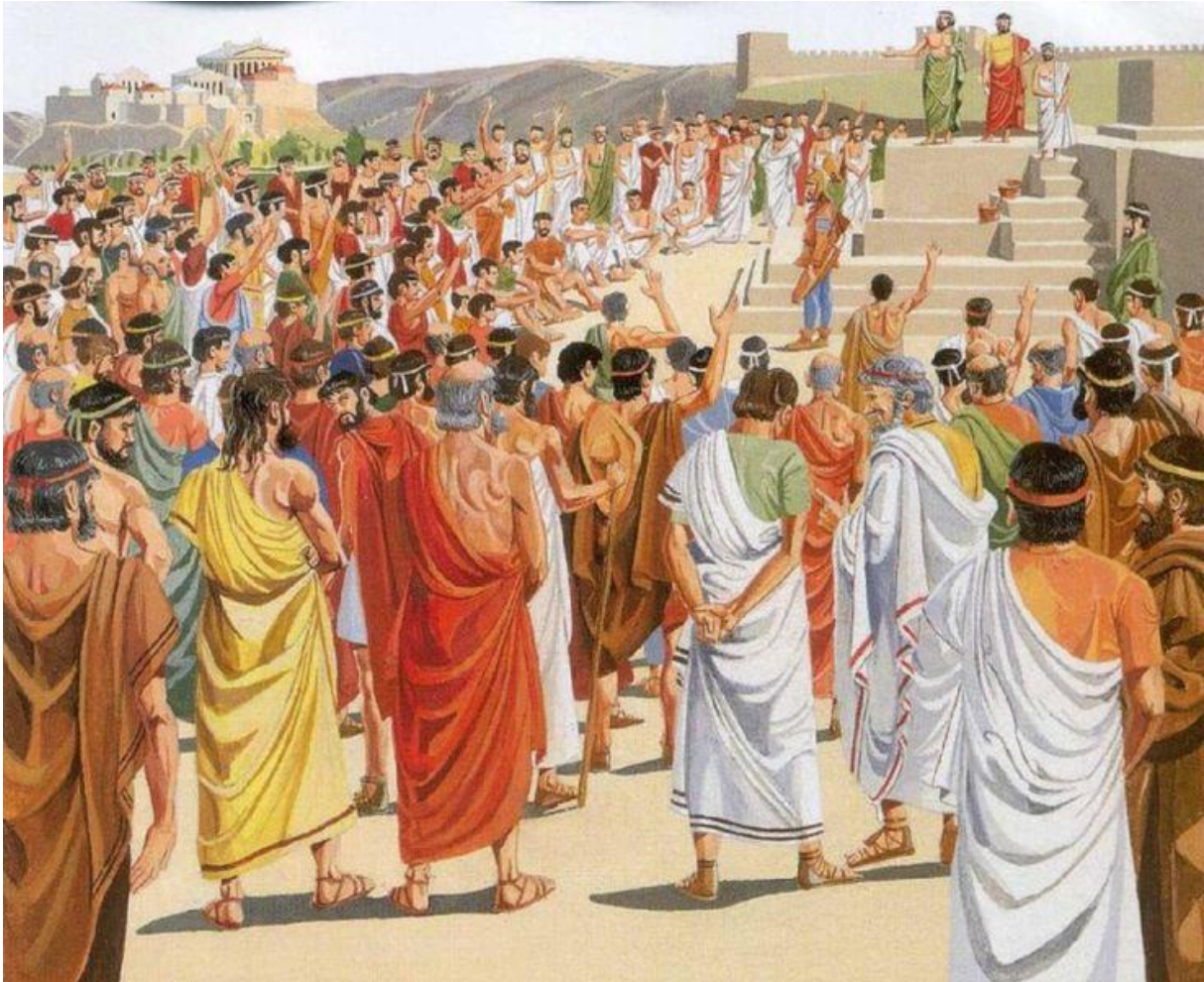
Democratie in het oude Athene (artist impression)

leggen we niet van bovenaf op. De ene groep zal zich meer senang voelen bij overleg in de buurtapp en de ander door huiskamerbijeenkomsten te organiseren. We geven wel een korte profielschets mee met een paar kernkwaliteiten die een buurtvertegenwoordiger sterker maken. We geven ook suggesties en ideeën mee hoe een discussie in de buurt gestimuleerd kan worden, maar we houden deze kort en we controleren ze niet. We accepteren dat er buurten zijn die om wat voor reden dan ook geen afgevaardigde aanwijzen bijvoorbeeld omdat het niveau van activiteit veel te laag ligt, al dan niet door een gebrek aan onderlinge cohesie. We gaan wel kijken of we via andere kanalen deze gaten in het 'grid' kunnen invullen, mochten er in sommige wijken teveel van zijn.