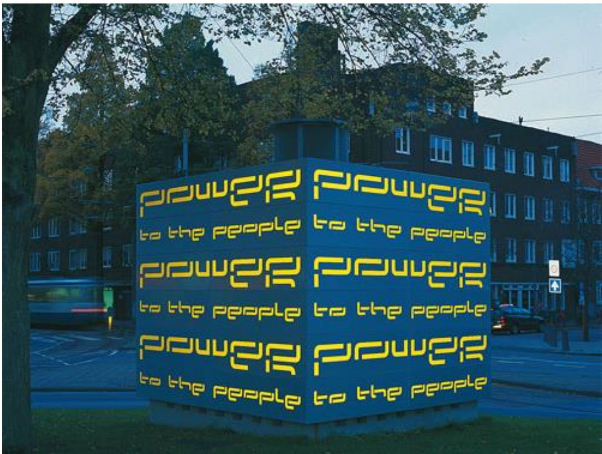
Kunstwerk 'Power tot the People' van Martijn Sandberg, Hoofddorplein, Amsterdam

De dag wordt afgesloten met een spetterend feest en lekker eten.