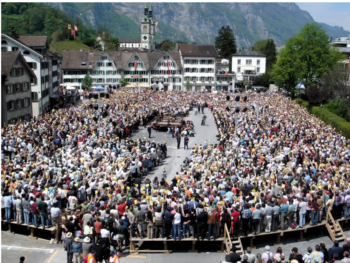
De volksvergadering (Landsgemeinde) is de hoogste autoriteit van het kanton Glarus (Zwitserland)

Er moet rekening mee gehouden worden dat een geldelijke vergoeding voor vertegenwoordigers tot een aanzienlijke kostenpost leidt: bij 3.000 buurtvertegenwoordigers en bijvoorbeeld een maandvergoeding van € 150,00 (de maximale belastingvrije vrijwilligersvergoeding) zijn de kosten op jaarbasis al € 5,4 miljoen. Bij uitkeringsgerechtigden moeten we er nog extra op letten dat zij geen problemen krijgen met hun vergoeding c.q. dat die niet in mindering wordt gebracht op hun uitkering.