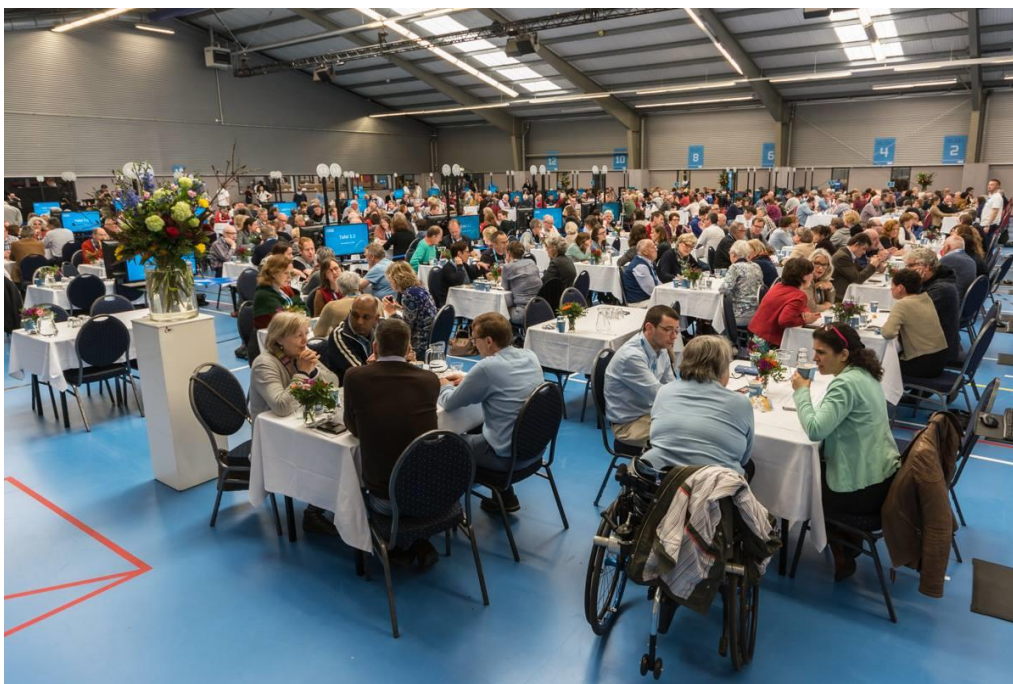
G1000-burgertop in Amersfoort (2016)

Als de volksvergadering plaatsvindt en er besloten wordt over de kwesties die in de maanden ervoor door de werkgroepen voorafgaand aan de volksvergadering zijn voorbereid, dan is de gemeenteraad voltallig aanwezig. De volksvergadering eindigt met een 'ritueel van bekrachtiging' van alle aangenomen besluiten door de gemeenteraadsleden onder voorzitterschap van de burgemeester, waarna een volksfeest met muziek en dans losbarst.